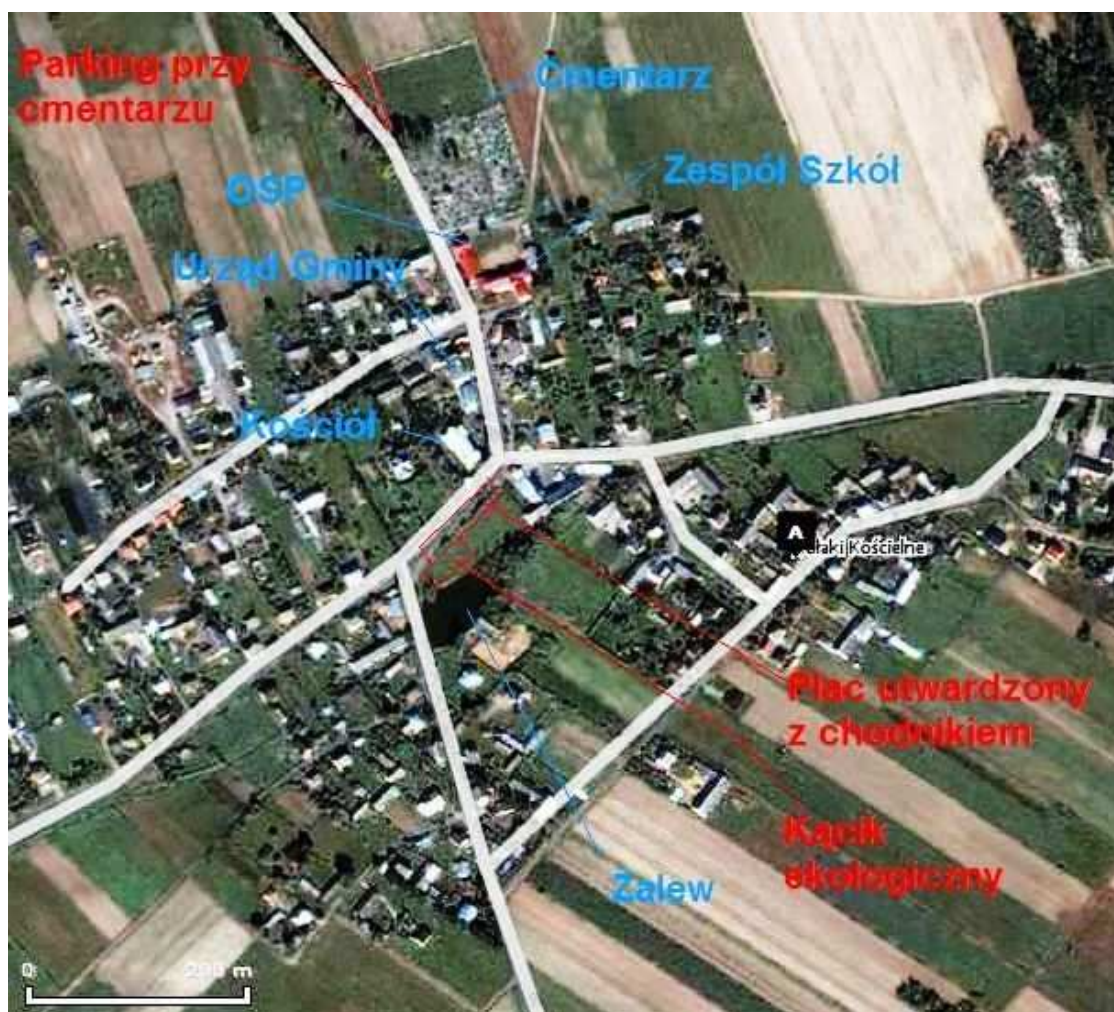
Fotografia nr 1. Zdjęcie satelitarne miejscowości Kołaki Kościelne