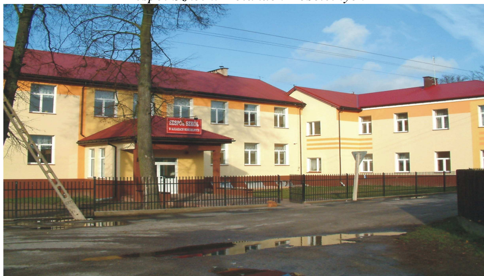
Fotografia nr 4. Zespół Szkół w Kołakach Kościelnych