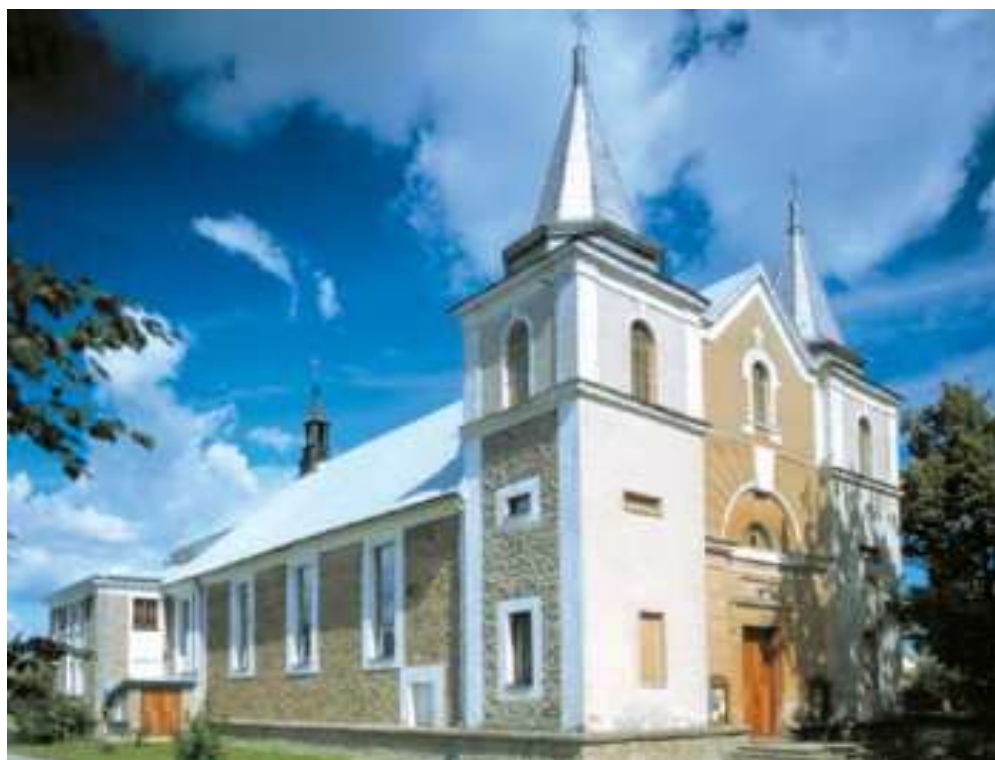
Fotografia nr 2. Kościół Parafialny pw. Wniebowzięcia NMP