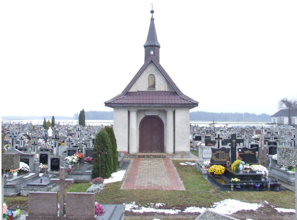
Fotografia nr 3. Cmentarz rzymskokatolicki