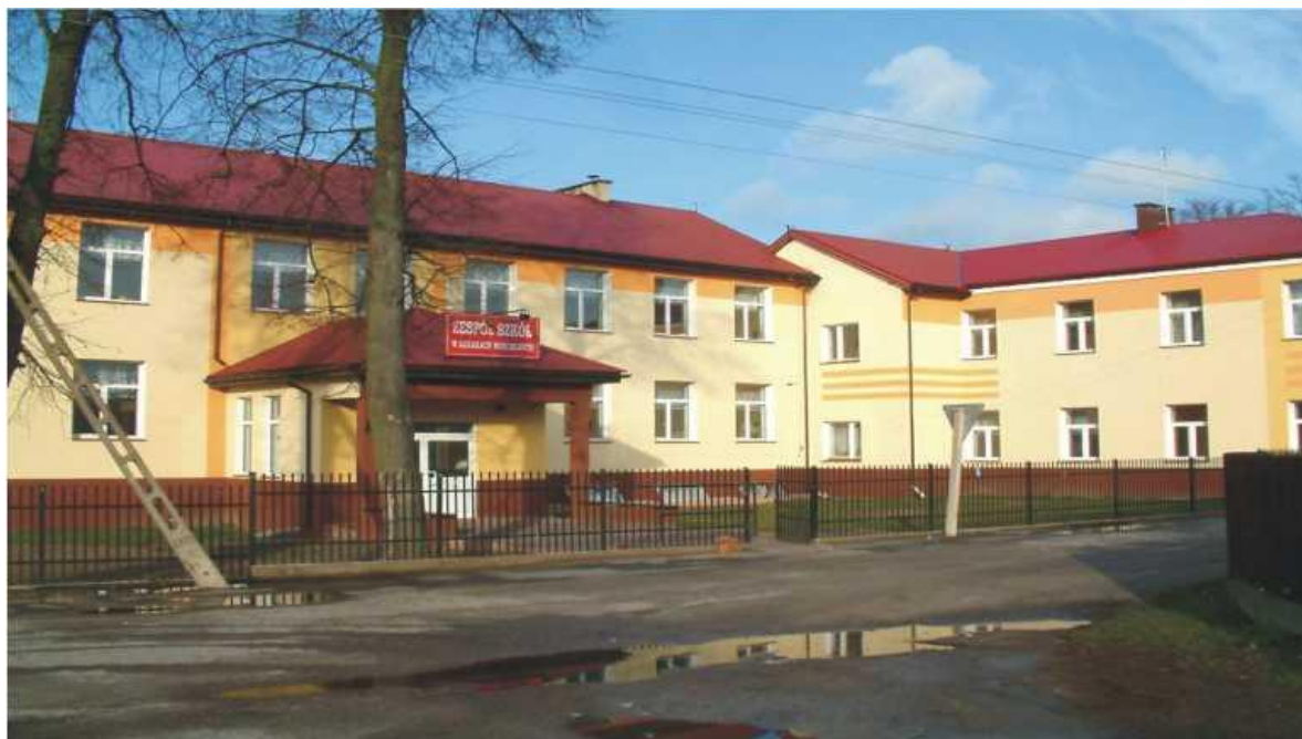
Rysunek 7 Zespół Szkół w Kołakach Kościelnych