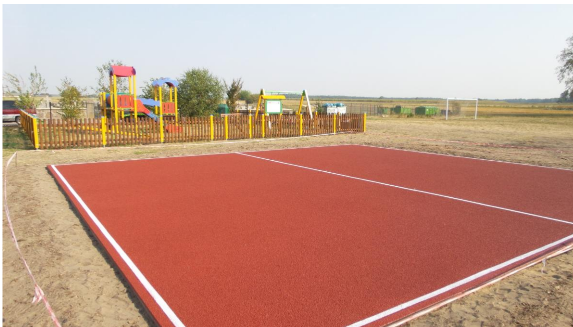
Rysunek 6. Plac zabaw z bezpieczną nawierzchnią

Również przy ul. Kościelnej znajdują się tereny zielone oraz zbiornik wodny. Teren jest częściowo zagospodarowany i pełni funkcję rekreacyjną. Umieszczone zostały tam również drewniane figury stworzone w trakcie I Pleneru Rzeźbiarskiego w Kołakach Kościelnych. Istniejące miejsce do rekreacji i wypoczynku nad stawem w Kołakach Kościelnych wymaga rozbudowy i modernizacji w celu zaspokojenia potrzeb mieszkańców