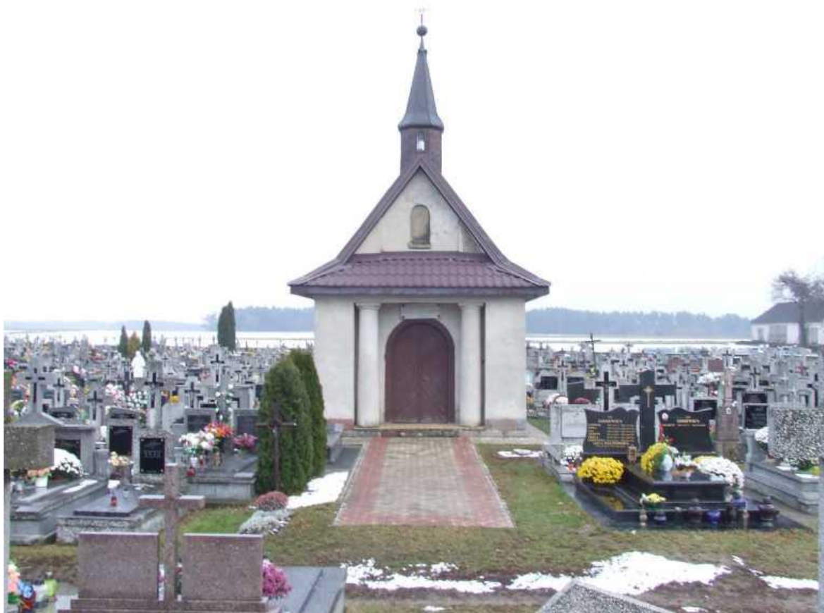
Rysunek 5. Cmentarz rzymskokatolicki

Obiekty sakralne są własnością Parafii pw. Wniebowzięcia NMP w Kołakach Kościelnych i to ona dba o ich wygląd oraz stan techniczny na miarę swoich możliwości finansowych. Gorsza jest sytuacja obiektów zabytkowych należących do prywatnych właścicieli, którzy ze względów finansowych nie zawsze dbają o ich właściwy stan techniczny. Grozi to bezpowrotną utratą tych niepowtarzalnych dóbr kulturowych.