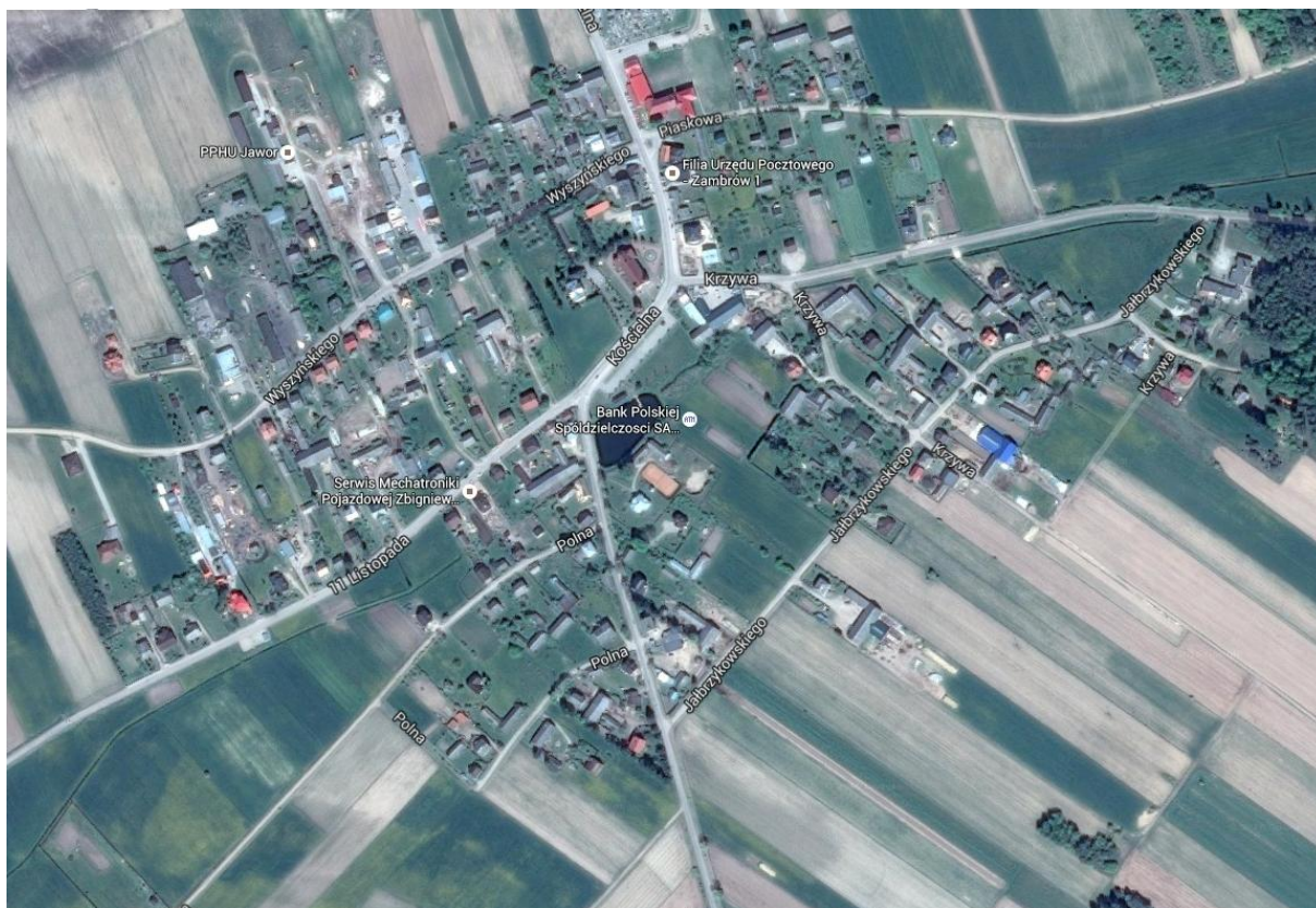
Rysunek 3. Miejscowość Kołaki Kościelne- zdjęcie satelitarne

Na dzień 31 czerwca 2015 r. na terenie sołectwa zamieszkiwało 452 mieszkańców w 138 budynkach mieszkalnych. W większości jest to budownictwo jednorodzinne i zagrodowe.