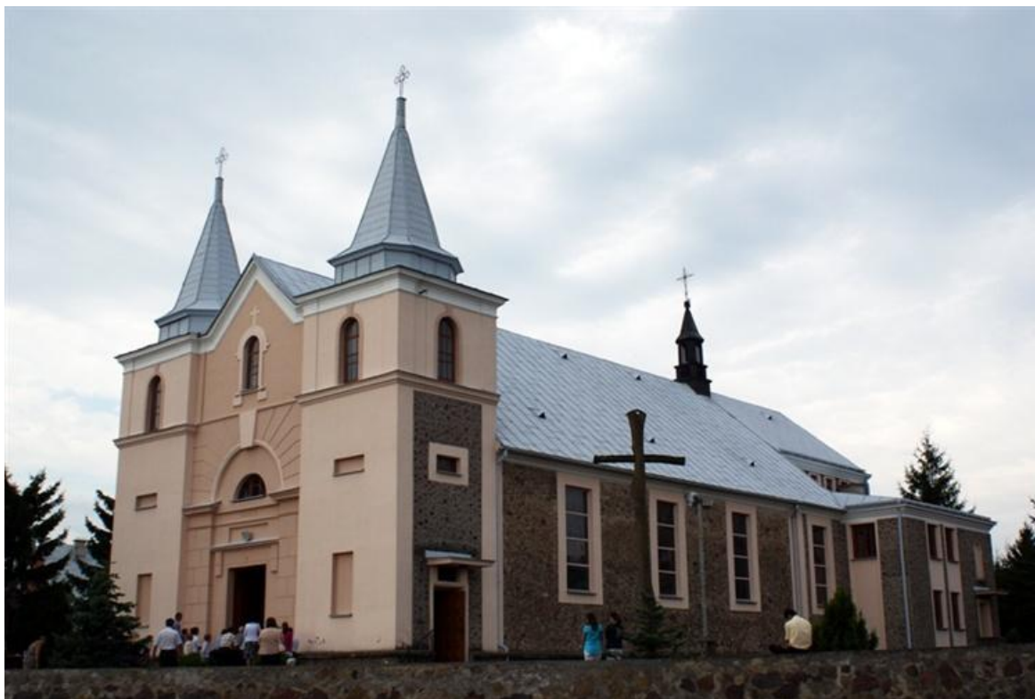
Rysunek 4 Kościół Parafialny w Kołakach Kościelnych

Na terenie miejscowości Kołaki Kościelne znajdują się obiekty zabytkowe wpisane do rejestru zabytków na podstawie decyzji Podlaskiego Konserwatora Zabytków. Są one wymienione w tabeli nr 2. Obiekty wpisane do rejestru zabytków objęte są ścisłą ochroną konserwatorską. Wszelkie prace przy obiektach i terenach zabytkowych oraz w ich bezpośrednim otoczeniu, w tym podziały nieruchomości winny być prowadzone za zgodą służb konserwatorskich.