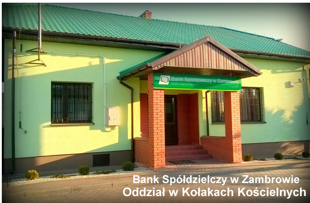
Bank Spółdzielczy w Zambrówie Oddział w Kołakach Kościelnych

Sponsorem wydania świątecznego „Wiadomości Gminy Kołaki Kościelne” jest Bank Spółdzielczy w Kołakach Kościelnych