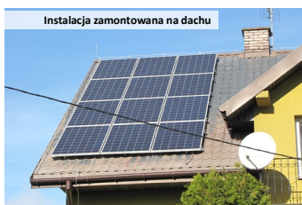
Instalacja zamontowana na dachu

Energia wytworzona przez ogniwa zostaje za pomocą inwertera (falownika) przekształcona na prąd zmienny o parametrach elektrycznych odpowiadających sieci publicznej. Prąd z inwertera ma znacznie większą częstotliwość co powoduje „wypychanie” prądu z sieci i wykorzystanie w pierwszej kolejności prądu z instalacji fotowoltaicznej na potrzeby gospodarstwa domowego. Nadmiar prądu, którego w danej chwili nie wykorzystujemy jest „odsyłany” poprzez licznik dwukierunkowy do sieci publicznej. Jeżeli wykorzystujemy więcej prądu niż produkujemy niedobór jest „dobierany” z sieci publicznej. Licznik dwukierunkowy zlicza energię elektryczną wyprodukowaną w instalacji fotowoltaicznej oraz pobraną z sieci. Zgodnie z net meteringiem, energia elektryczna wytwarzana przez prosumenta we własnej instalacji i dostarczana do sieci publicznej rozliczana jest poprzez odejmowanie jej od ilości zużytej energii z sieci publicznej