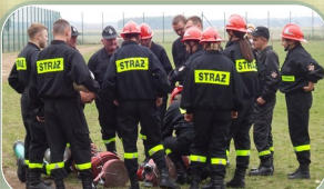
Sukces OSP Kołaki Kościelne w Szumowie