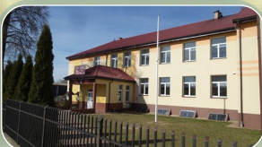
Z życia szkoły