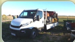
Powodzenie zbiórki odpadów wielkogabarytowych